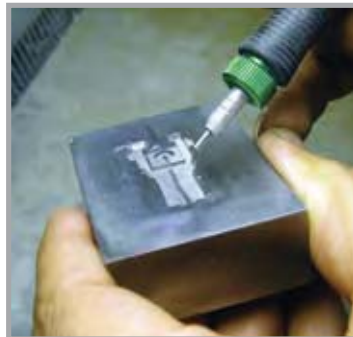
微喷砂技术可构刻纹理及清洁模孔

微研磨喷砂技术（简称微喷砂），就是将微米大小的研磨颗粒和干燥压缩空气的均匀混合物通过一个小喷嘴高速喷，从而对多种部件及其表面进行清洁、切割、清除毛刺或构刻纹理等。这种方法简单而有效。