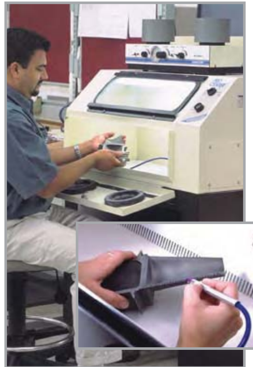
微喷砂技术可用来清洁涡轮叶片上的激光钻孔