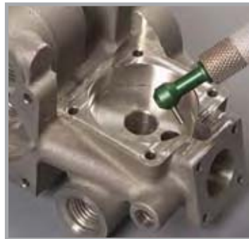
微喷砂技术可用于清理集气管口的毛刺

航空元件的制造要保证产品的可靠性及寿命，因此对质量要求甚高。微研磨喷砂技术为一系列航空元件提供了一个安全有效的解决方案。称重传感器和应变计通过用微研磨喷砂技术构刻纹理提高了复合部分的粘合力。微研磨喷砂技术在清理阀门组件上的横孔、紧固件刃口半径处的毛刺、以及清洁激光钻孔处的浮渣和复熔都更加有效。